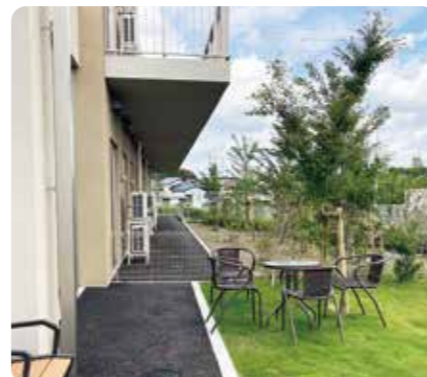
庭園(エントランス前)